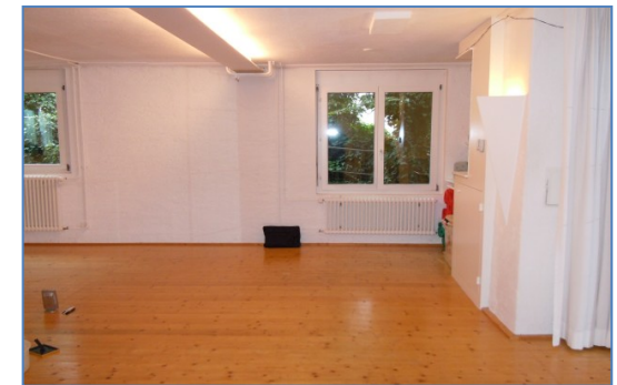
Kursort PUK Rheinau